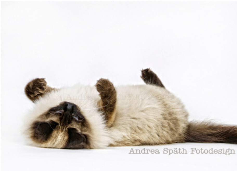
Andrea Späth Fotodesign

Diese süße Hunde-Dame samt mir und der Besitzerin hatten einen Riesen-Spaß während unseres Foto-Shootings und ich finde - das sieht man auch :)