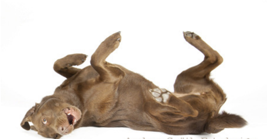
Andrea Späth Fotodesign

Diese süße Hunde-Dame samt mir und der Besitzerin hatten einen Riesen-Spaß während unseres Foto-Shootings und ich finde - das sieht man auch :)